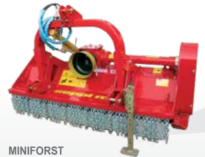
MINIFORST klassischer Forstmulcher ohne pick-up-Satz 55 - 90 PS Leistungsbedarf an der Antriebswelle, zerkleinert Gebüsch und Gehölz bis zu 12 cm Ø